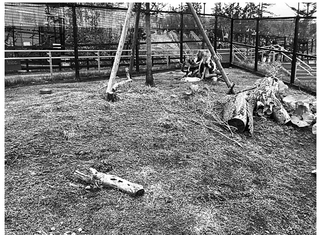
図 1. 旭川市旭山動物園ユキウサギ飼育施設の状況

ユキウサギ Lepus timidus は、日本では北海道平野部から亜高山帯まで比較的広範に生息するため、身近な動物を把握して頂く教育・啓発活動の一環として道内動物園などで展示されることが多い。今回、そのような形で飼育されていたユキウサギの幼若個体が斃死し、剖検によって、毛様線虫類の濃厚寄生状態が確認された。毛様線虫類にはオステルターグ胃虫や捻転胃虫のように、反芻家畜に直接感染し、重篤な疾病原因となる種も含まれるが [1] 、ウサギ類における病原性に関する知見はほぼ皆無であった。そこで、今回、ユキウサギを健康的に飼育する一助として、本症例の報告をする。