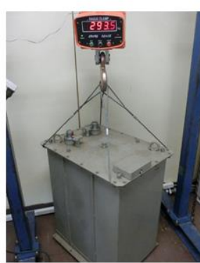
装置内のコンデンサーの確認作業の様子

X線発生装置内部の確認調査により①、②、④に振り分ける必要があります。下記北海道またはJESCOにご連絡ください。