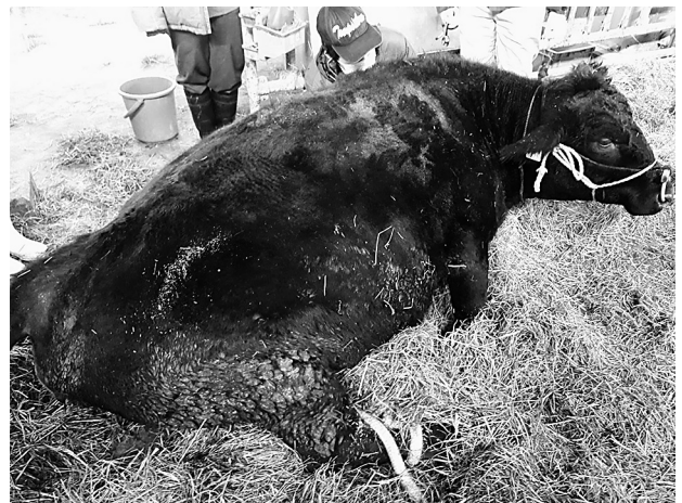
図1. 初診時の様子(自力での起立が不可能な状態)

症状の経過 ：初診時(第1病日)の体温は38.6℃、心拍数は68回/分、呼吸数は32回/分で、食欲減退、自己起立不能、四肢筋肉の振戦、発汗、消化管運動の停止、心音不整、水様性下痢、皮膚・耳介の冷感などが認められた(図1)。第1病日の治療後夕方には自己起立、維持は可能になった。第2病日は自己起立、維持は可能で、前日より発汗量は減少し、四肢の振戦も消失した。心音