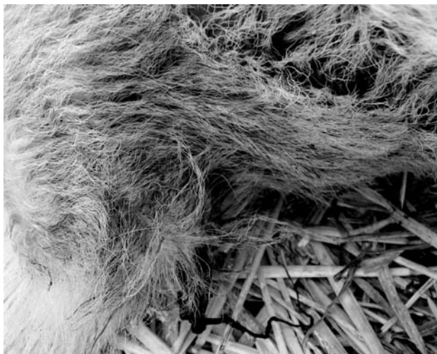
図1 臍周辺の被毛は出血のため暗赤色に汚れている。

臍動脈周囲に広範に出血が認められた。臍部から膀胱間の2本の臍動脈内を中心に、それぞれ2x3x8 cm大の血腫様組織が認められた(図2)。血腫様組織の臍動脈内には凝血塊がみられた(図3)。皮下出血等は認められず、また骨髓の異常もみられなかった。病理学的には、臍動脈閉鎖不全および臍動脈周囲出血と診断された。