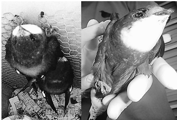
図1. 酪農学園大学野生動物医学センターに収容されたハリオアマツバメのヒナが飼育用ダンボール箱壁面に取り付けられた金網に懸垂して休息する様子(左)と腹部検査の様子(右)

以上の形態概観はMenoponidae科のハジラミ類で、Palma [1] が定義した Dennyus 属 Takamatsua 亜属と一致した。このカタログ [1] で参照されたニュージーランド産ハリオアマツバメから得られた虫体が若虫ニフであったため、種名は保留されていた。なお、ハリオアマツバメは日本には夏鳥として飛来し、おもな越冬地はニューギニアからオーストラリア東部とされている。よって、Palma [1] のニュージーランドにおける発見事例は偶発的の事象であったかもしれない。ところで、その記載 [1] 中に重要参照種として、 D. (T.) major が紹介され