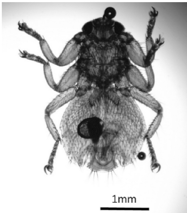
図1. ヒグマ胃内容物から得られたヒメシカシラミバエ L. fortisetosa の雌.

標本使用のご許可を頂いた道総研環境・地質研究本部環境科学研究センターおよび当該標本に関し契約書作成をして頂いた本学研究支援課の各位に深謝する。