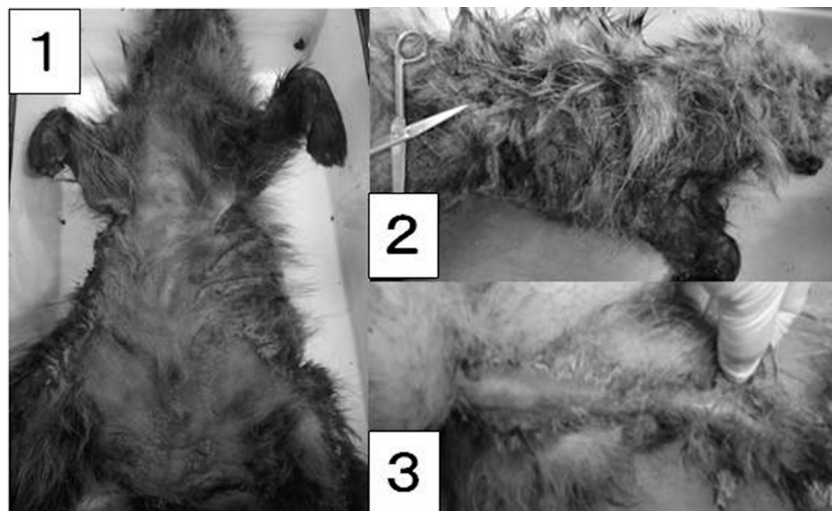
図1. 釧路市動物園内で収容されたタヌキにおける疥癬による脱毛と痂皮の状態 (図1-1: 腹側面、図1-2: 右側面、図1-3: 尾部)

とキツネに加え、アライグマ Procyon lotor で認められた [3-9] 。タヌキの疥癬が報告された地域は、いずれも石狩地方あるいは知床半島に限定されている [3-9] 。キツネの疥癬はこれら2地域以外に、根室半島でも認められ [5] 、また、釧路市動物園で保管されていた標本の回顧的な調査でも、キツネ由来のセンコウヒゼンダニが保存されていたので [10] 、根釧地方にもこのダニ類によ